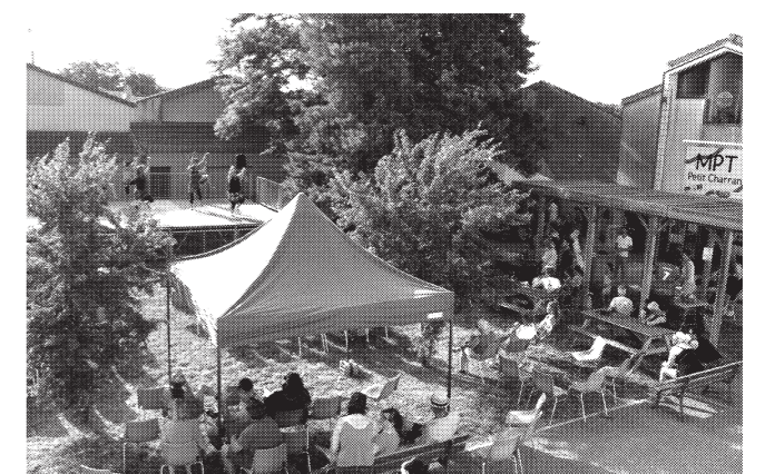
© Jannice G. — Photographie réalisée lors de la fête de quartier 2025.

● Mar. 9 juin — à partir de 12h Inscriptions aux mercredis pour la rentrée 2026-2027 à l'accueil de loisirs